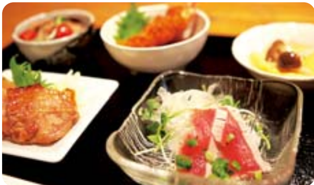
色鮮やかな5種のおかずにごはん・お味噌汁が付く