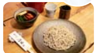
ブランドの京鴨を使った「鴨汁そば」は治部煮(じぶこ)風が特徴