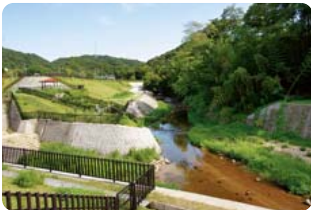
空が広くて開放的な空間