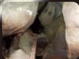
矢印を頼りにとんとん奥へ

石仏一つ一つには意味がある!ただ通り過ぎるのはもったいない。立ち止まってじっと眺めてみてください。何か思いが湧いてきたら、そっと石仏に語りかけてみてください。