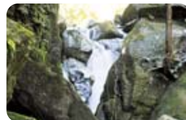
船が引き返したという「船返し」の滝