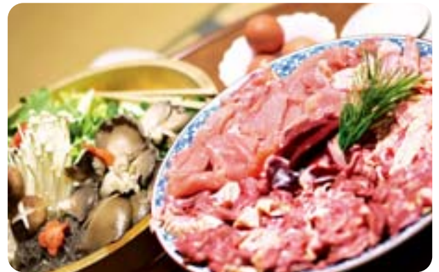
野菜の水分と鳥肉の旨みがくせになる