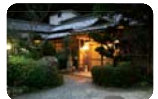
ひっそりとしたたたずまい