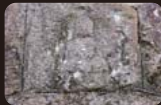
石垣の阿弥陀さま