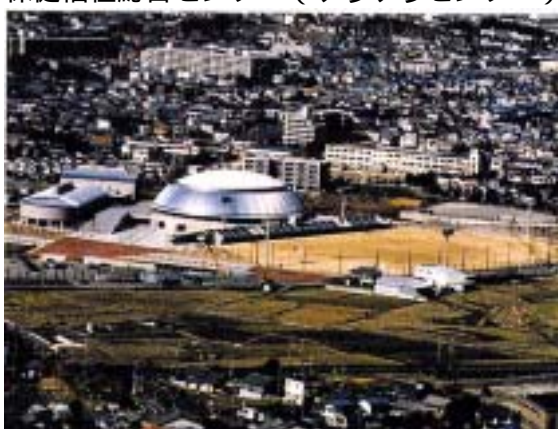
総合体育施設（いきいきランド交野）