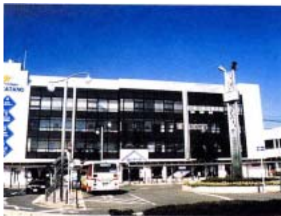
星のまちあいあいセンター

JR星田駅周辺は本市の西部地域の拠点として、豊かな自然と調和した市街地整備が進んでおり、行政機能として星田出張所が立地しています。京阪私市駅周辺は、山地部の豊かな自然環境の玄関口であり、スポーツレクリエーションセンター（星の里いわふね）が立地しています。