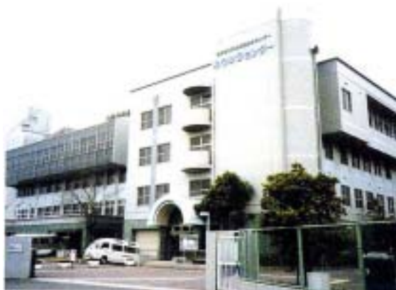
保健福祉総合センター（ゆうゆうセンター）