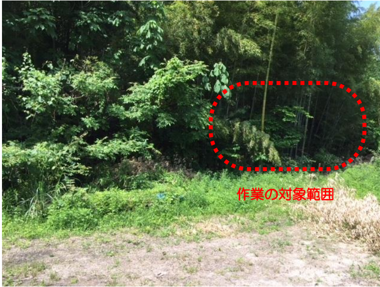
① 作業前（大字星田地内星田9丁目53地先）