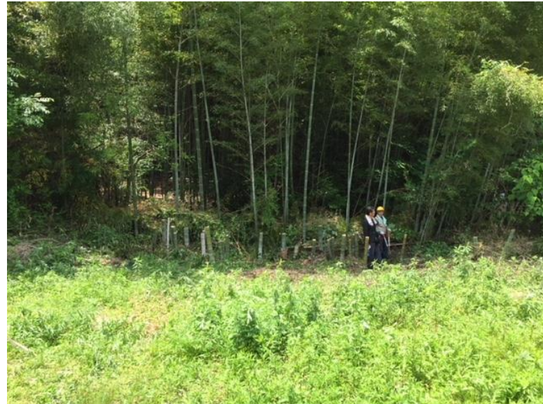
④ 隣接地への影響改善と里山に光を取り入れる事ができました。