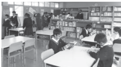
図書室は、毎週月・水・金曜日に図書ボランティアの協力により開室しています。利用者は、年間延べ1,000人を超えました。