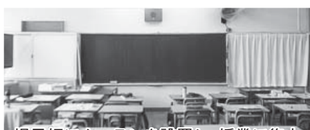
掲示板にカーテンを設置し、授業に集中