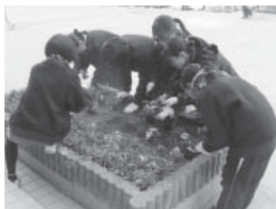
生徒たちが学校の花壇を整備しています。