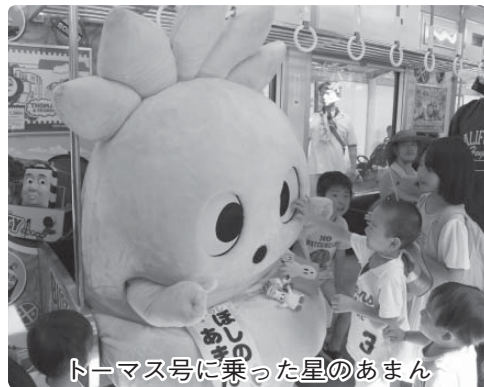
トーマス号に乗った星のあまん