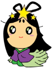
交野市産業PRキャラクター おりひめちゃん

緑豊かな里山の自然環境と共存し、子育てや教育環境の充実を図り、住みたい、住み続けたいまちづくりを進めている 交野市 と、植物を有用な資源として収集・保存し、教育・研究利用をはじめ、生物多様性の理解促進のため展示・公開するなど地域貢献に取り組む 市大植物園 が、同じ環境の中で、目標に向かって連携・協力し、豊かな将来のために市民サービスの一層の向上をめざします。