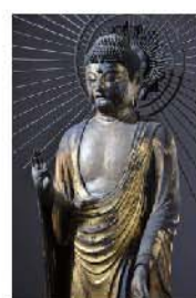
国重要文化財 快慶作阿弥陀如来立像 (八葉蓮華寺)

※土・日曜日・祝日は、観覧希望文化財氏名・電話番号を記入のうえ、FAX(892・1700)で受け付けます。