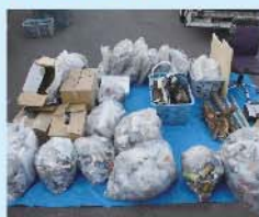
収集した不法投棄物