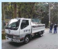
山間部パトロール