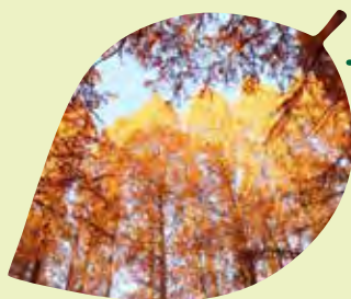
メタセコイアの紅葉

メキシコ原産で明治に渡来したキク科の一年草で、秋桜ともいい、10月には白色または淡紅色、深紅色の花を開きます。英語で「宇宙」の意味です。