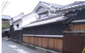
昔ながらの趣を残す集落