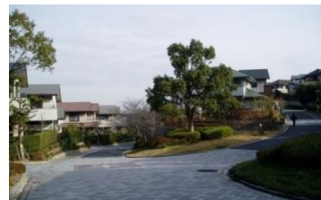
計画的に整備された新興住宅地