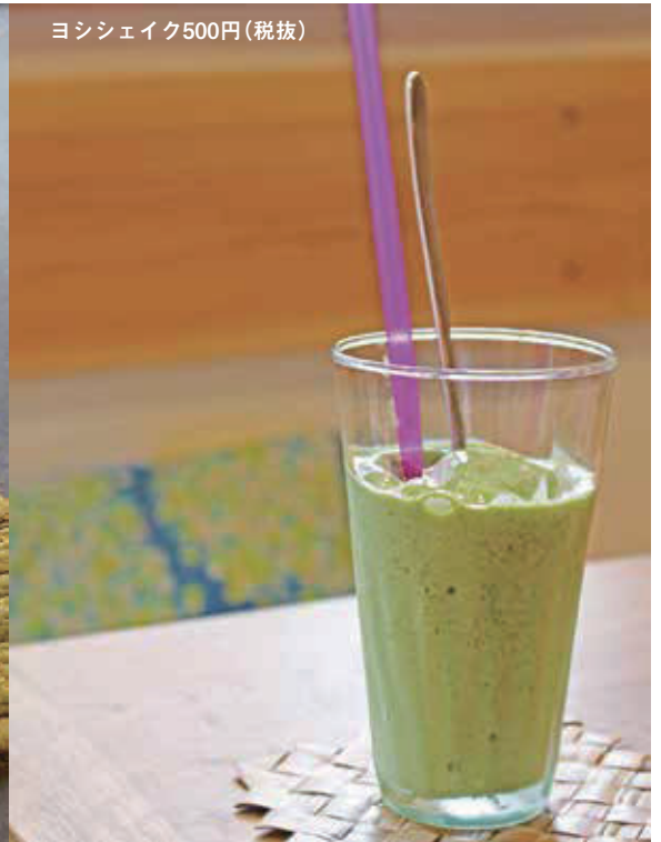
ヨシシェイク500円(税抜)