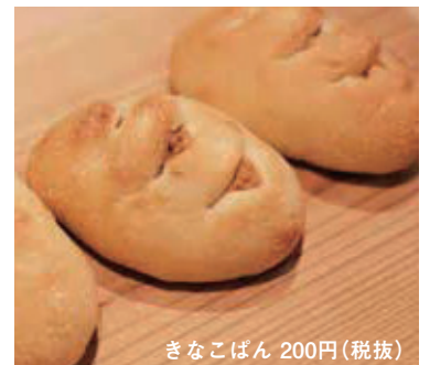
きなこぱん 200円(税抜)

ヨシクッキーは、小麦粉を一切使わず、あわやひえ等と混ぜて焼き、ヨシの葉をイメージしています。かめばかむほどヨシを楽しんでいただける仕上がりになっています。ヨシシェイク他、ヨシを使った食パンやあんパンも人気です。オススメ商品はきなこぱん。中にはねっとり濃厚なきなこのあんがたっぷり入っています。当店の商品は全て天然酵母を使用、卵や乳製品動物性食品を使っていませんので素材の味がそのまま生きています。ぜひ味わってください。