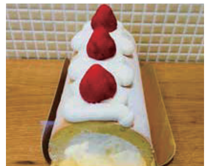
ナナフル ロールデコレーション 1,680円(税抜)

イチオシ商品はナナフルロールデコレーション。岡山県の希少小麦100%の薄力粉「 たいはく でえーれえー粉」や北海道産の生クリーム、ごまを生搾りして作った太白ごま油を使用したロールケーキです。