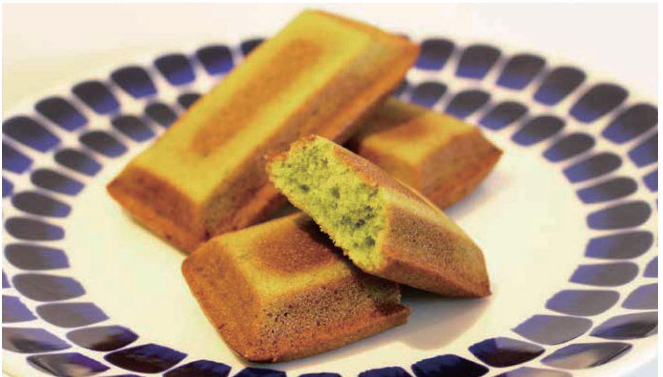
ヨシフィナンシェ1個200円(税抜、要予約)