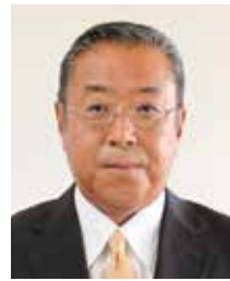
野口陽輔 国民民主党(現)