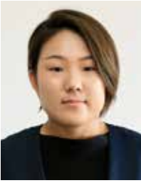
藤田菜里 日本共産党(現)