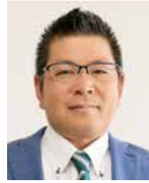
岡田伴昌 大阪維新の会(現)