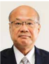
友井健二 公明党(現)