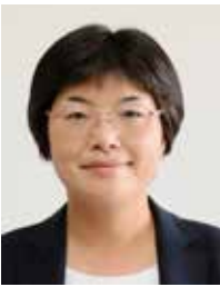
皿海ふみ 日本共産党(現)