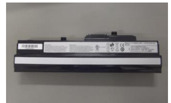
ノートパソコン用