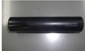
モバイルバッテリー