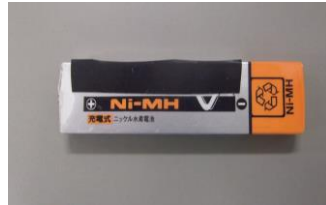
携帯音楽プレイヤー用