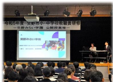
小中一貫教育研修 交野が原学園