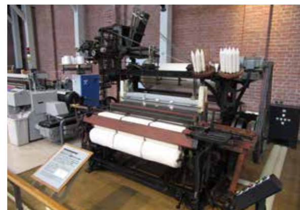
原田式 タオル織機