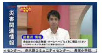
テロップイメージ

市はJ:COMと防災協定を締結しており、J:COMを契約していれば避難情報等をL字テロップで確認することができます。