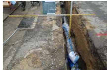
水道管工事の様子