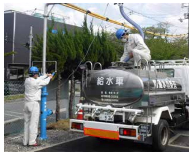
緊急時給水栓から注水する様子