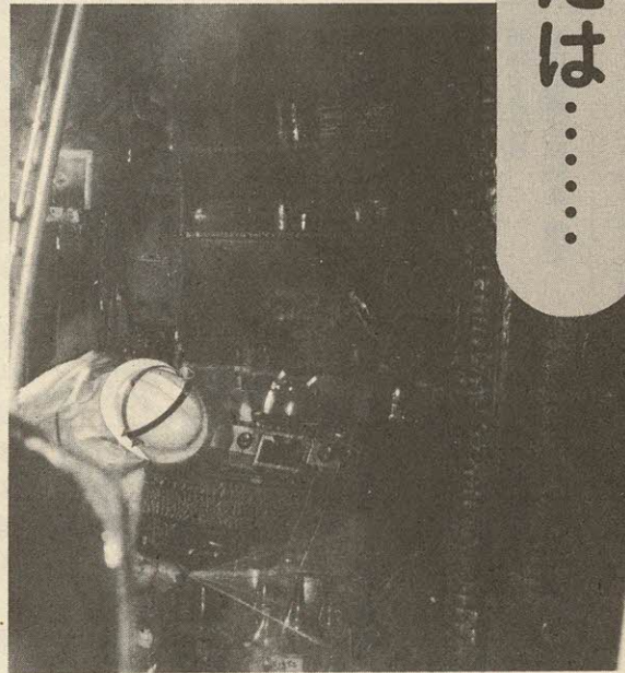
ちょっとした不注意が大切な財産を灰にする

火災は、社会的な損失が大きいばかりか、人のいのちにかかわることです。それに、あなたの家が火元となると、隣近所に向けた迷惑でそこに住みつくことはできません。