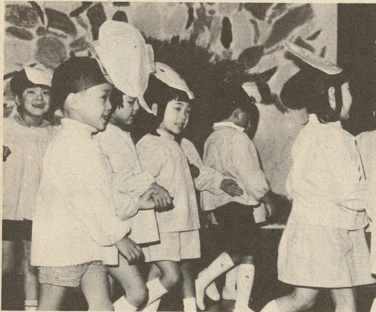
昨年(市立第三保育所)の生活発表会から