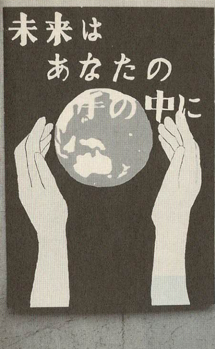
啓発ポスターに選ばれた坂田さんの作品