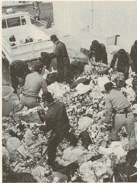
モデル地区の私市で収集された瓶などの資源ごみ(6日)

環境事業部は10月から私市地区(1200世帯)をモデル地区に指定、瓶を資源ごみとして収集を始めました。収集日は第3水曜日から第