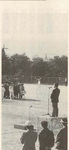
市民スポーツデー開会式 (私部公園グラウンド)