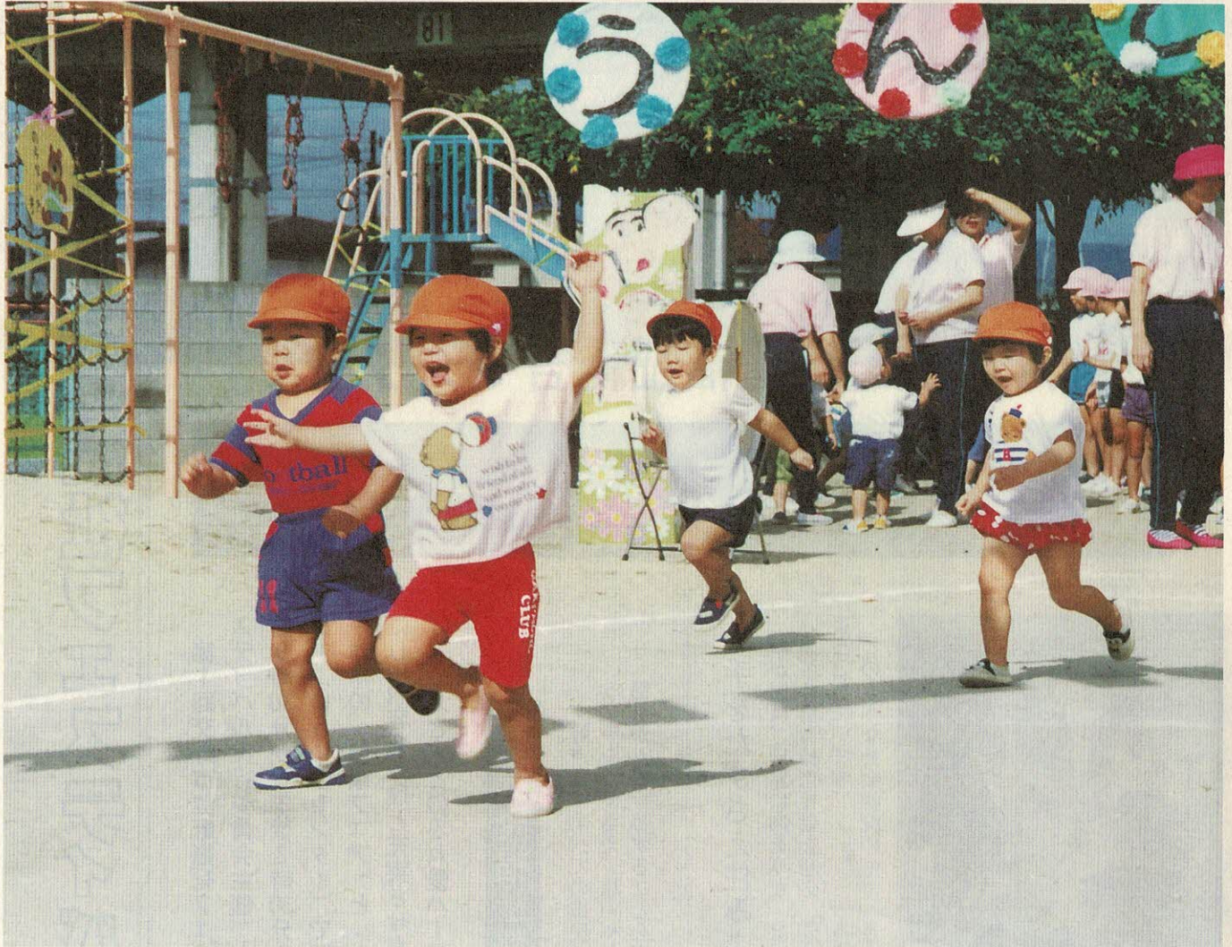
あさひ幼稚園運動会