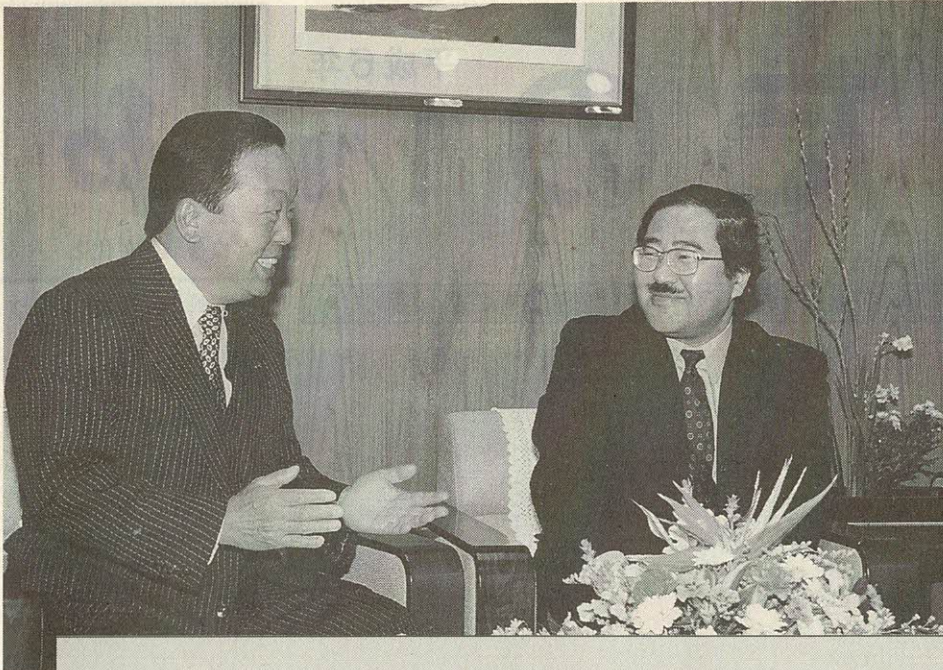
白澤助教(右)と対談する北田市長