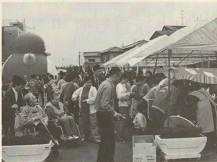
にぎわう健康福祉フェスティバル