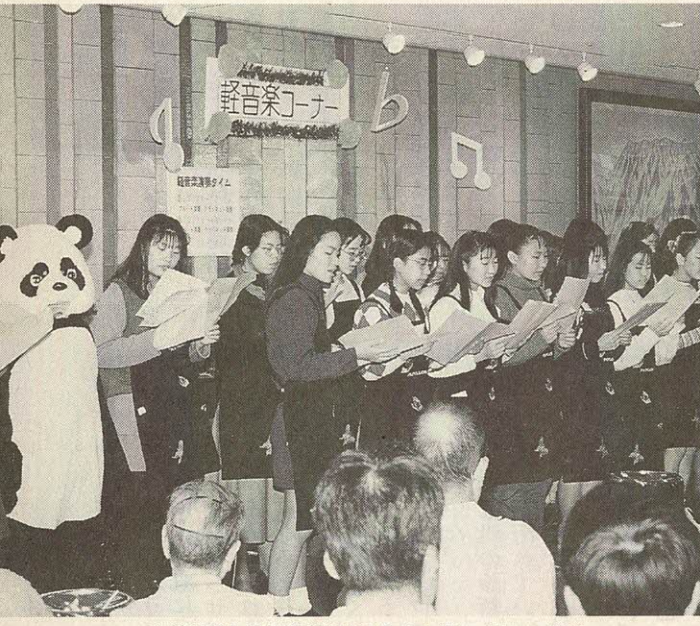
友情出演した相愛高校のみなさん(フェスティバル)