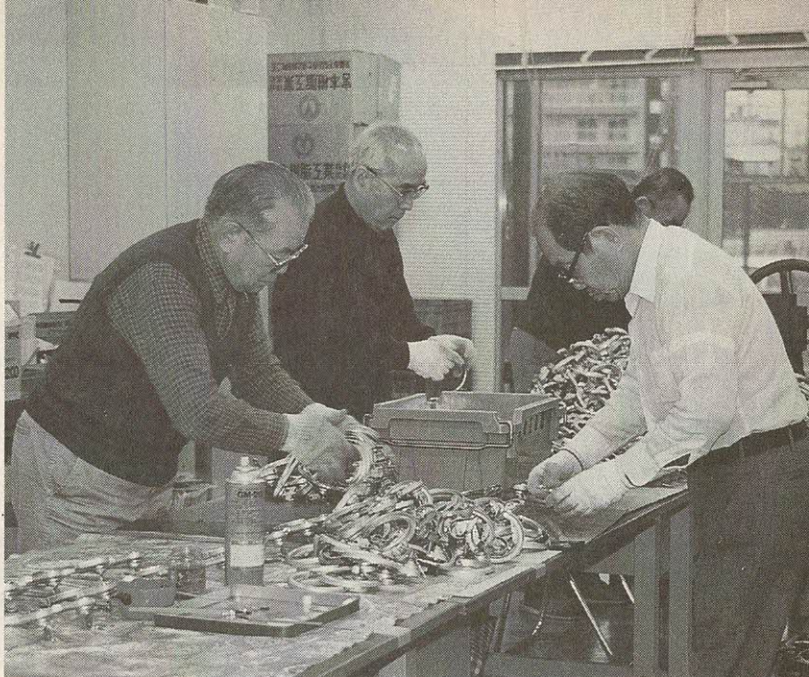
作業に励むお年寄り(シルバー人材センター)