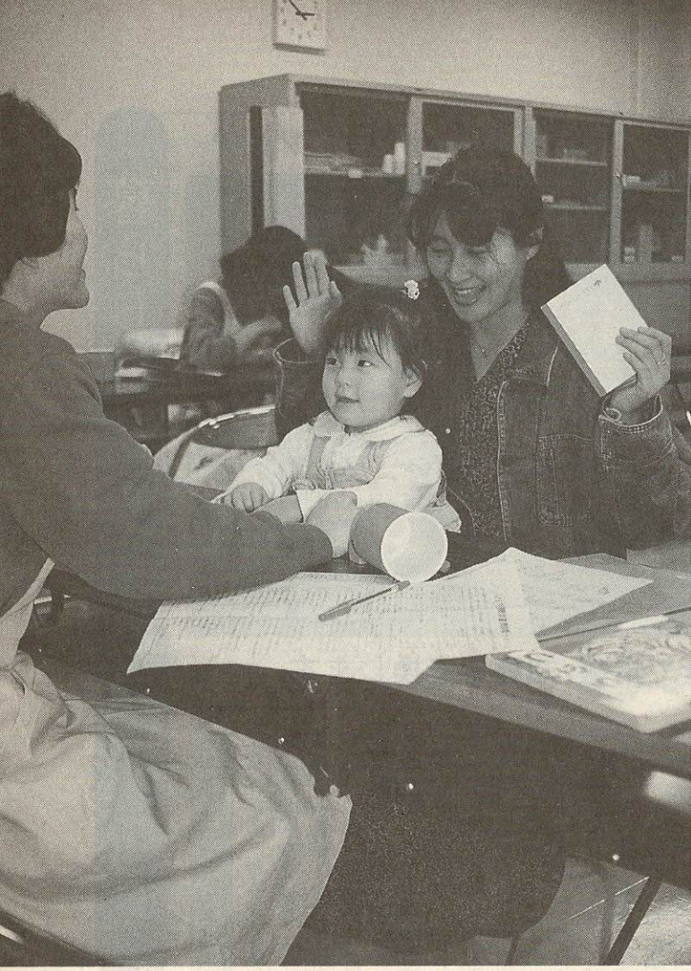
1歳6か月児検診(総合センター)