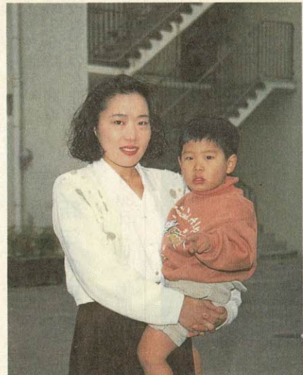
「わが家の料理」を募集しています。市長公室広報担当までご連絡ください。