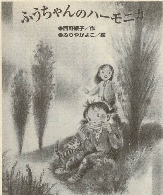
●西野綾子/作 ●ふりやかよこ/絵