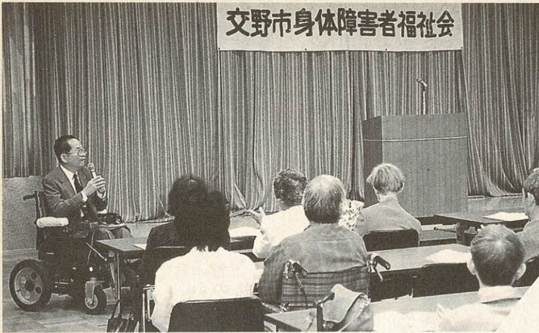
交野市身体障害者福祉会