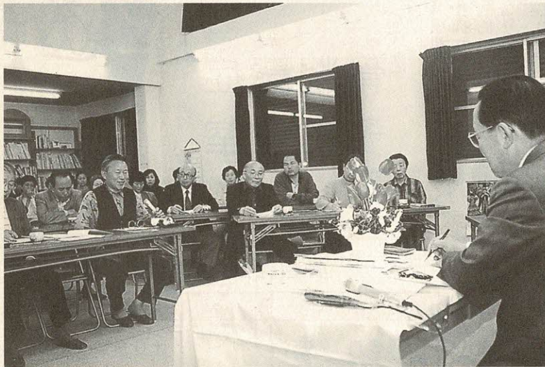
質問や提言をメモする市長

員による週4日の個別相談を行い、相談件数(実績)は、9年度230件、10年度319件と年々増加しており、多くの市民のみなさんが消費者としての悩みを持つていることが分かります。このことから、事業の見直しをすることで、事務の効率的な運営を図り、6月1日から週4日を週5日(常設)へと相談日を増やすことにより、行財政改革の目的の柱でもある市民サービスを向上させ、市民のみなさんが安心して生活できるようなサービスの充実をめざしています。今後は、常設の相談業務を実施するとともに、より一層事務体制を整えながら、国民生活センターへの登録も含め、情報収集などの充実を図ってまいります。消費者からの相談を、より円滑かつ効果的に行うことで、消費者行政の充実を図り、より身近な市民サービスが提供できるよう、今後とも行財政改革の推進に努めてまいります。