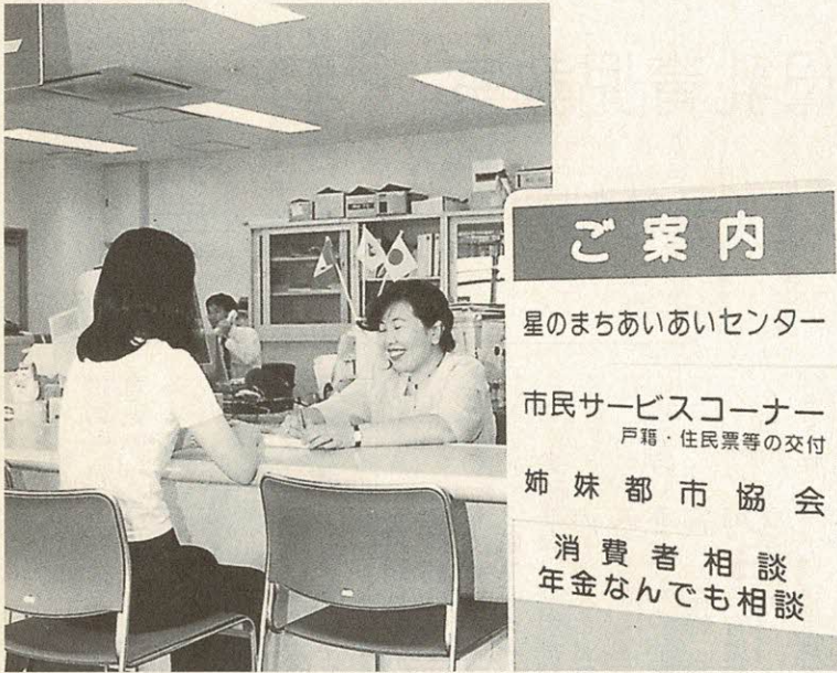
あいあいセンターで開かれている「消費者相談」

多くの市民のみなさんが、星のまちあいあいセンターで行われている「消費者相談」を利用されています。相談コーナーでは、消費者と事業者の間の情報力、資金