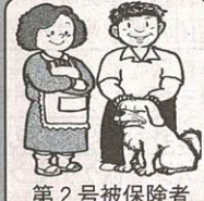
第2号被保険者 医療保険に加入している40歳～64歳の人

家族や居宅介護支援事業所などが代理申請もできます。その際、日ごろ本人の心身の状態についてご存じの医師（主治医）の氏名・医療機関名などをお聞きしますので確認しておいてください。 第2号被保険者については、加入されている医療保険の被保険者証をご持参ください。