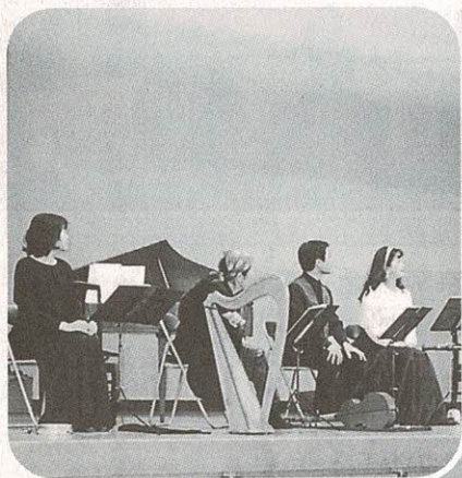
三中学校区子どもを育てる会発足記念事業 トーク&コンサートの集い 伸び伸び気軽な子育てを