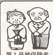
第1号被保険者 65歳以上の人

家族や居宅介護支援事業所などが代理申請もできます。その際、日ごろ本人の心身の状態についてご存じの医師（主治医）の氏名・医療機関名などをお聞きしますので確認しておいてください。 第2号被保険者については、加入されている医療保険の被保険者証をご持参ください。