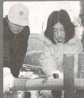
「かま」に入る長さに切る