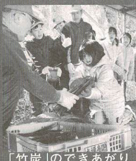
「竹炭」のできあがり

ぼくは、竹を切ると自然はかくなると思っていたけど、竹を切らないとクヌギ・コナラがはえても栄養をとられて育たないから山にとってはやさしいと教えてもらった。 竹はもやすと炭素がでて二酸化炭素がでて地球にわるいと思っただけどむすからあまり炭素がないしにおいを消す効果があるので一せき二ちようだなど思った。 2日目は竹を切つてリトルグラウンドの上の1日目に行ったところにもっていくさきようだった。竹を切つてメジャーではかったら16・21cmの最高記録だった。太くてじようぶな竹だったので切りにくかった。でも、ちゃんと切れた。竹を切つたらヤモリがでてきて、つかまえた。友達ヘルメットにつけて、また竹の中にがした。竹を切るの楽しかった。またやってみたい。