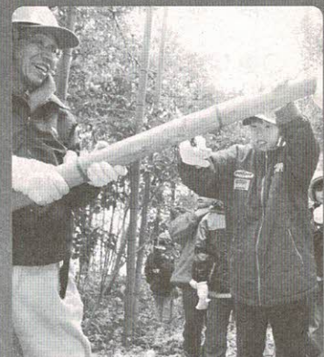
運ぶため短く切る