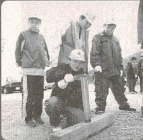
さらに細かく割る