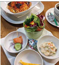
おりひめランチセット2021 1,200円

★デジタルスタンプラリー特典★ 1,000円以上の飲食・ティクアウトの方は10%OFF