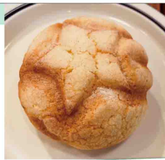
星のメロンパン 145円

こだわりのバターシュガーを使用したクッキー生地、表面はカリッと香ばしくほどよい甘さが人気の、星のマーク入りメロンパンです。