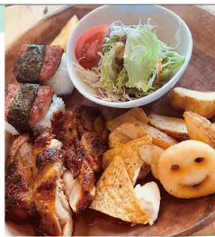
本日のハワイごはん 800円

日本のおうちごはん、ハワイのおうちごはん、ドリンク、スイーツが楽しめるお店です。