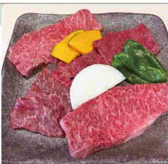
七夕ペアセット 3,905円

自慢の特選セットのミニ盛です。和牛丸ごと一頭買い付けだから、希少部位が日替わりで次々と登場します。