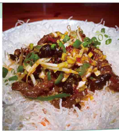
華菜しんの川炒め 1,400円

彦星の牛と織姫の織糸が交野のTENTENで遭遇！当店秘伝のタレ甘辛の四川炒めでどうぞ。