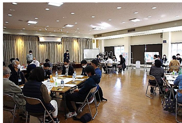
当日の会場の様子