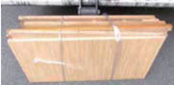
こちらもバラバラにならないよう ひもくくりで