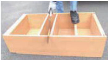
作業はけがにご注意を