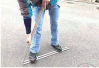
カーテンレールは1メートル未満に折って