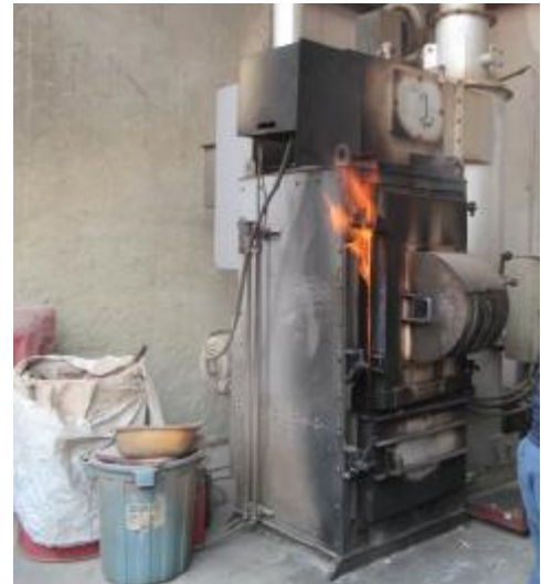
(基準を満たした焼却炉であっても) 劣化等で炉が密閉できていない