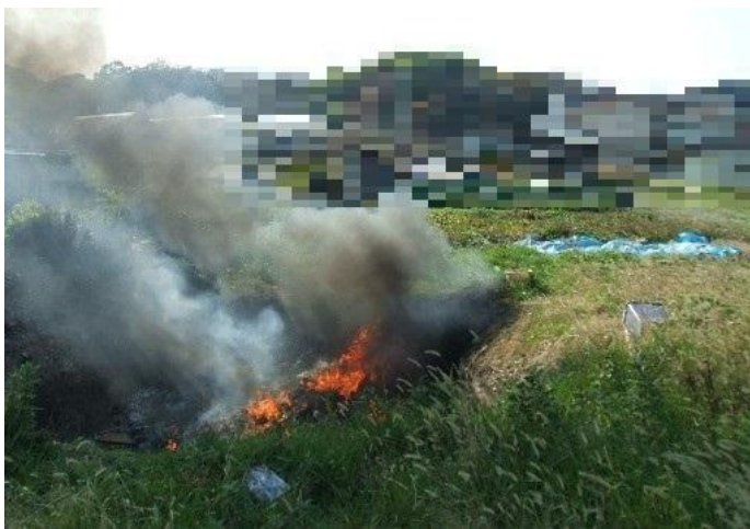
農業用ビニールシートなどを野焼き