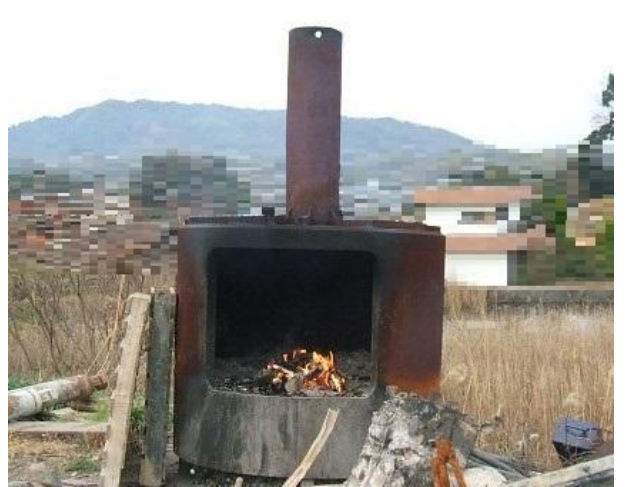
基準を満たさない焼却炉で焼却