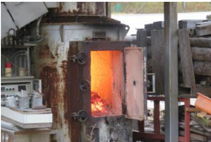
(基準を満たした焼却炉であっても) 炉を開けたまま焼却