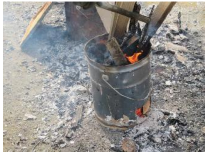
木くずなど廃棄物の焼却による暖取り