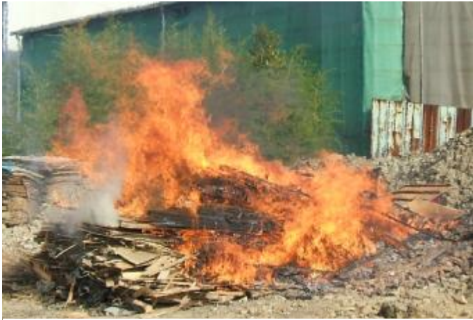
あからさまな野焼き