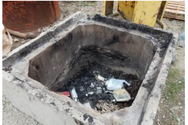
弁当がらなどの焼却