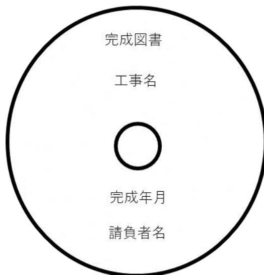
図：記憶媒体への印字例