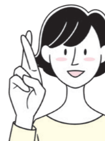
人さし指と中指を組む