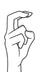
人さし指と中指を折り曲げる