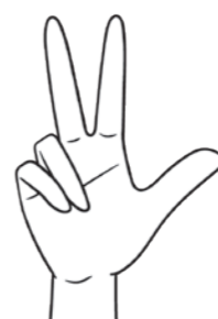
カタカナの「ル」の形