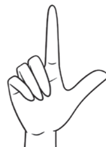
カタカナの「レ」の形