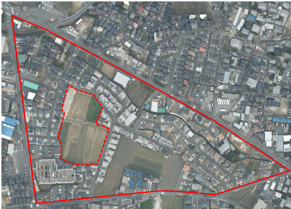
R6 ※点線範囲内は計画区域外